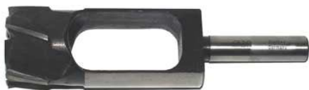
zátkovník 90 mm